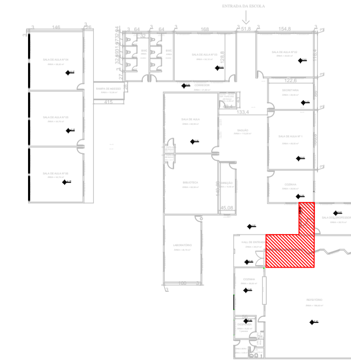
PLANTA BAIXA LOCALIZAÇÃO DA ÁREA DE INTERVENÇÃO S/ESCALA